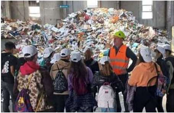
Una visita di studenti all'impianto di trattamento rifiuti del Cermec (foto d'archivio)